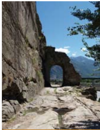
Strada e arco romano tagliati nella roccia

La viticoltura a Donnas è infatti estremamente impegnativa, sia per la forte pendenza dei vigneti, affrontata da secolari terrazzamenti trattenuti